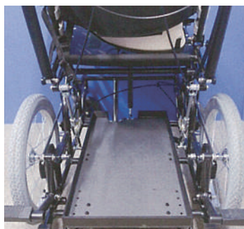
大容量の座面下アンダートレイを標準装備 人口呼吸器と痰吸引機が並列配置できます。 ※並列配置できない機種もあります。