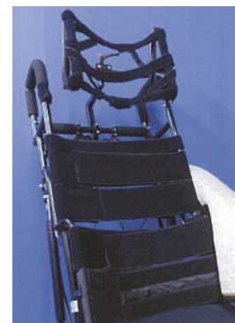
頸部から支持する、張り調整式ヘッドサポート、幅広合わせベルトによる背張り調整機構付