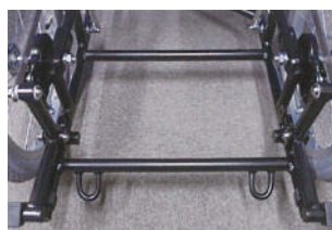
福祉車両乗車時の車載用フック掛けを標準装備